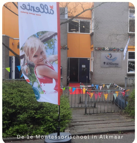
De 1e Montessorischool in Alkmaar