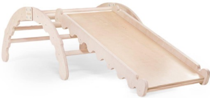
Motorische materialen Emmi Pikler