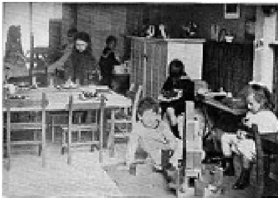
Montessori-kinderen in hun klas (ca. 1907)

In 1907 opende ze het eerste kinderdhuis - Casa dei bambini - in de wijk San Lorenzo in Rome. Om het leven in de buurt te verbeteren, start een organisatie met de bouw van twee gebouwen om een kansarme bevolking te huisvesten. De directeur vraagt Maria Montessori vervolgens om het leven van de kinderen van deze gebouwen te organiseren om te voorkomen dat ze rondwalen, wanorde zaaien en gezins-harmonie tot stand brengen.